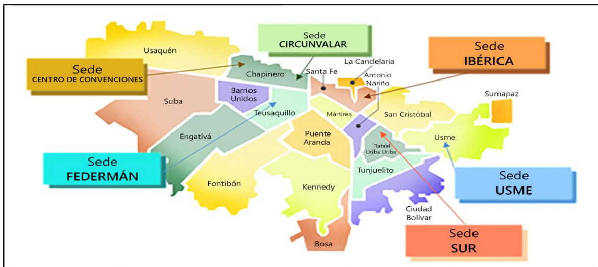
Figura 1. Campus en Bogotá