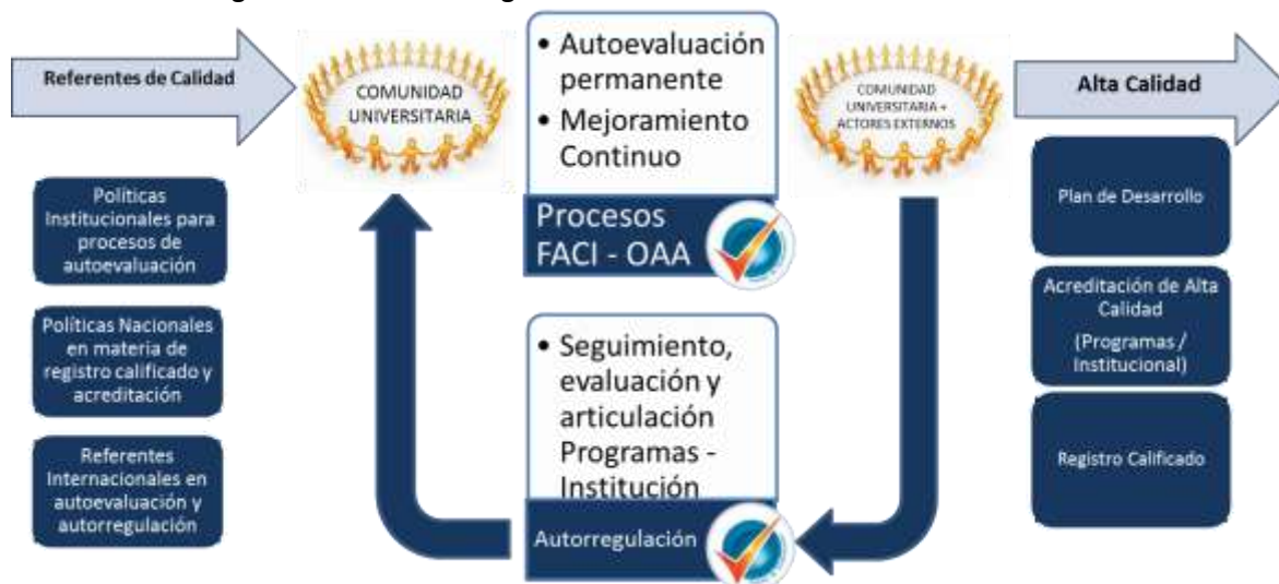
Figura 1. Sistema de aseguramiento interno de la calidad educativa - UAN