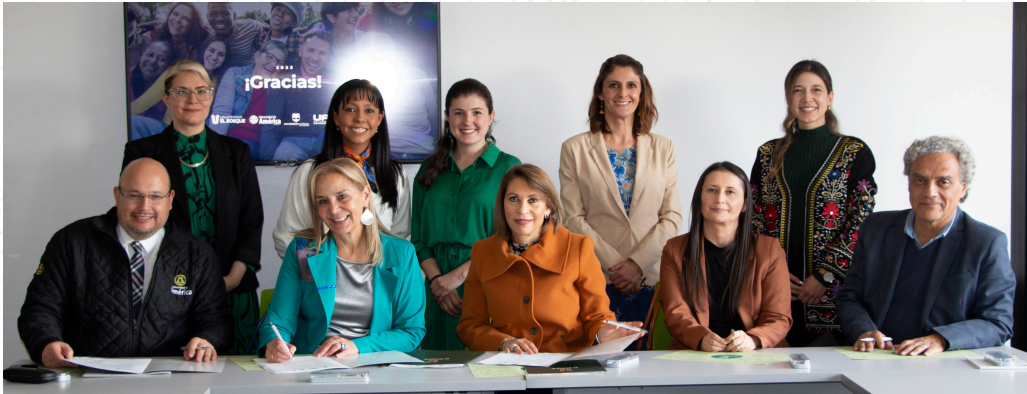
Firma del Convenio e instalación de la Cátedra ODS a cargo de cinco universidades de Bogotá