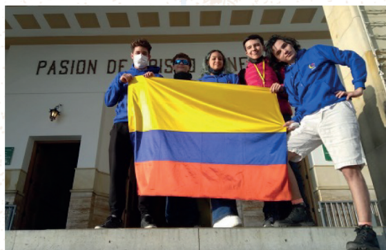
Participantes en las XIV Olimpiadas Internacionales de Astronomía y Astrofísica

Una Universidad comprometida con el país y la Agenda Global de Desarrollo que hace de la cooperación nacional e internacional un instrumento para el crecimiento y mejoramiento continuo”