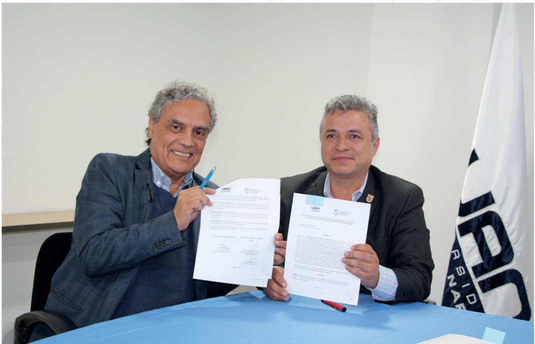
Convenio Marco de Cooperación con la Universidad Autónoma de Querétaro, México

Se han desarrollado acciones y actividades para continuar con la promoción de la internacionalización del currículo acorde con las tendencias vigentes, como del desarrollo de competencias para una segunda lengua (club de idiomas, centro de idiomas y currículo), prevalecer la interculturalidad al ser preponderante en el contexto UAN, continuar con trabajo tendiente a migraciones y el fortalecimiento de las redes académicas.