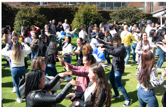
Actividad en el día del colaborador

La UAN a partir de su estructura, evidencia que cuenta con recursos adecuados para la gestión y administración, en términos de personal idóneo, infraestructura adecuada, laboratorios, recursos bibliográficos, informáticos y de apoyo docente.