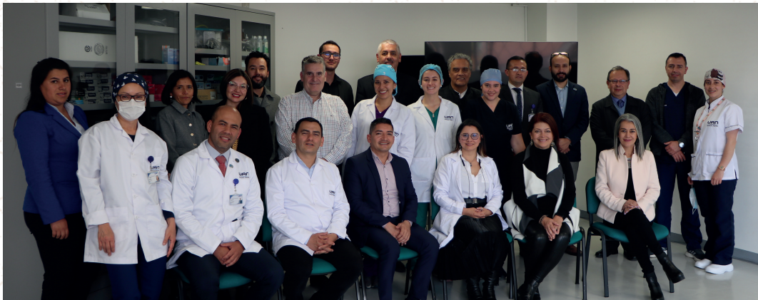
Inauguración Laboratorio de Simulación Clínica Campus Circunvalar

La UAN posee un patrimonio propio, que le da solidez financiera y se denota una asignación apropiada de recursos financieros para la operación y la inversión de la misma, lo que le da estabilidad, en los parámetros de racionalidad económica y financiera, eficiencia, eficacia y calidad, y de igualdad y equidad; en todos los casos, enmarcados dentro de los parámetros fijados a través de los objetivos y metas estratégicas definidas para toda la institución y consignados en el PEI y PID.